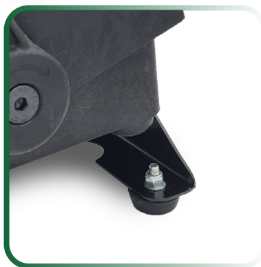
STAFFA DI RIALZO